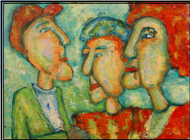
60 x 80 akryl

Jeg har malet i tre år, jeg har altid tegnet, men først nu er jeg begyndt at male for alvor.