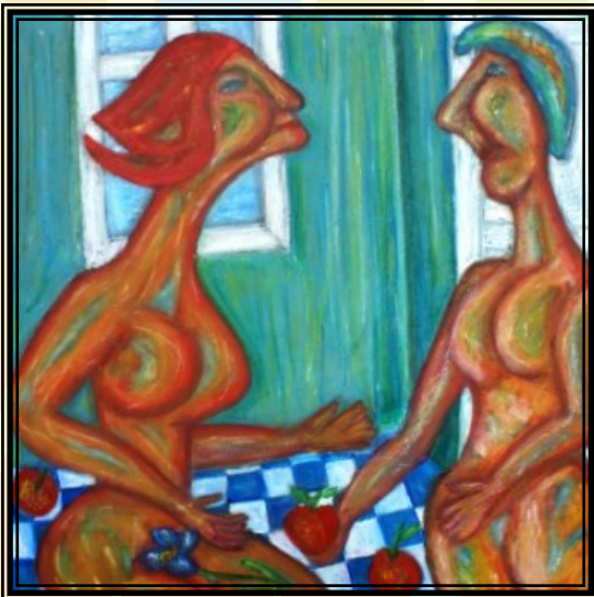
100 x 100 olie

Jeg er uddannet socialpædagog i 1989 og har arbejdet som sådan lige siden, pt. som familieplejer.