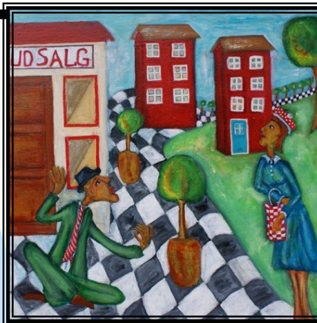
80 x 80 akryl