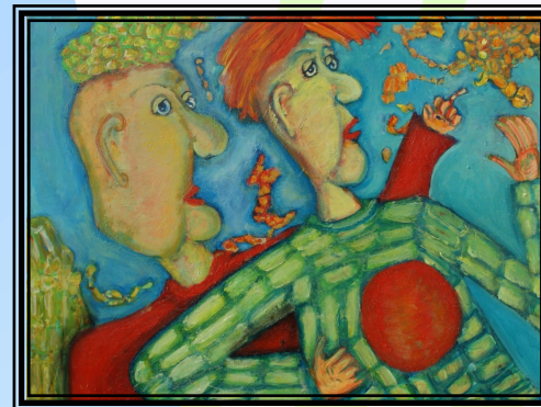
60 x 80 akryl