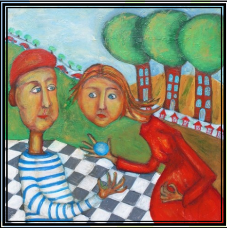
80 x 80 akryl

Jeg er uddannet socialpædagog i 1989 og har arbejdet som sådan lige siden, pt. som familieplejer.