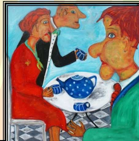
80 x 80 akryl